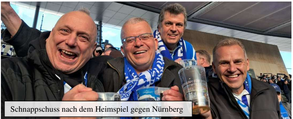
Schnappschuss nach dem Heimspiel gegen Nürnberg

Am: Samstag, den 27.03.2027 ab .... wird noch bekanntgegeben Ort : wird noch bekanntgegeben Startgeld: wird noch festgelegt